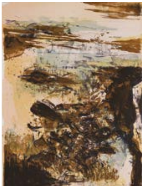
Zao Wou-Ki, Élégie pour Jean-Marie , 1978

Cabinet des arts graphiques & parcours permanent Musée d'Art moderne Collections nationales Pierre et Denise Lévy