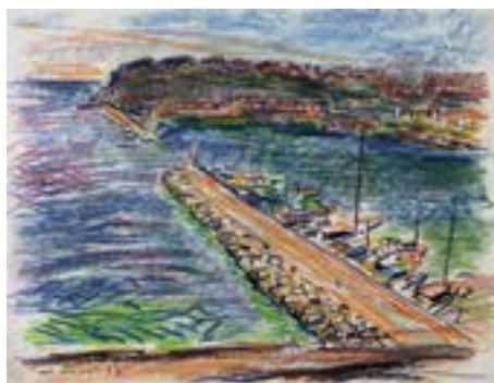
Maurice Marinot, La Rade de Monte-Carlo , 1957

Cabinet des arts graphiques Musée d'Art moderne Collections nationales Pierre et Denise Lévy