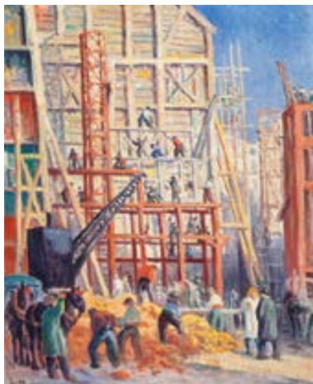
Maximilien Luce, Le Chantier , 1911

Musée d'Art moderne Collections nationales Pierre et Denise Lévy