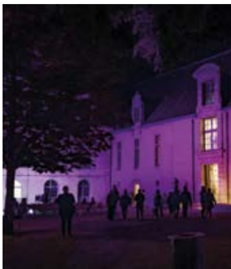
Nuit des musées 2025