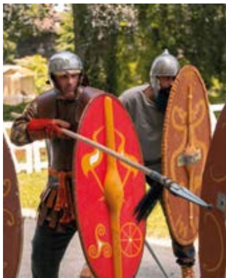
Troupe des Branno Teuta - JEA 2022