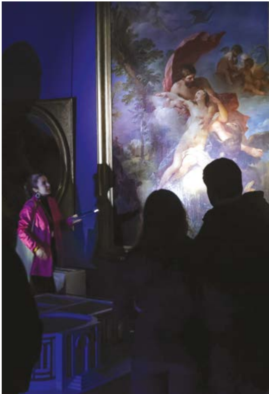
L'Amour au musée, visite à la lumière de la lampe torche