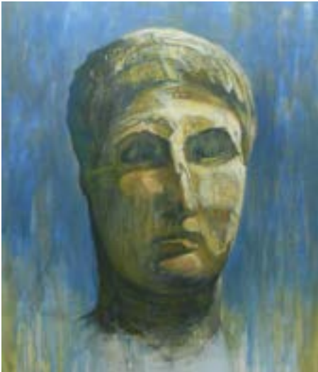
Visage statue grecque @ Jean Kiras

Cabinet des arts graphiques Musée d'Art moderne Collections nationales Pierre et Denise Lévy