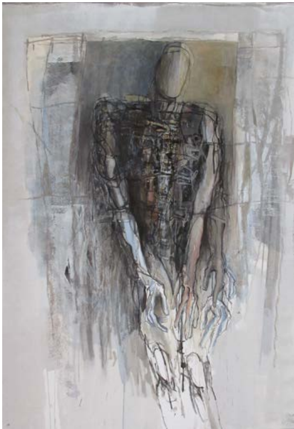
Homme incertain, mains jointes © Jean Kiras