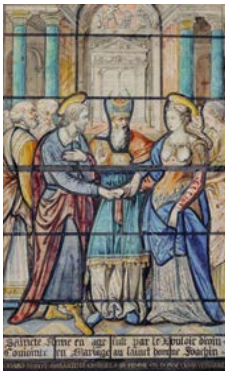
Charles Fichot, d'après Linard Gontier, Le Mariage de sainte Anne et saint Joachim , avant 1901

Cabinet des arts graphiques Musée des Beaux-Arts et d'Archéologie Abbaye Saint-Loup