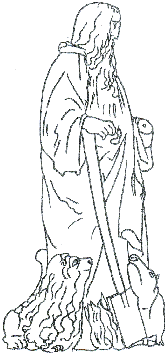
Saint Antoine, pierre, début du 16 e siècle Musée de Vauluisant, Troyes

A l'origine, ma statue était polychrome (elle avait plusieurs couleurs). Avec le temps, la peinture s'est effacée. Imagine quelles pouvaient être mes couleurs puis colorie moi.