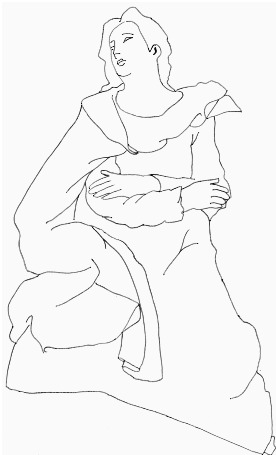
Saint Jean de Dominique Florentin, pierre, 2 e moitié du 16 e siècle Musée de Vauluisant, Troyes

Je suis saint Jean . J'étais un des apôtres de Jésus et son plus fidèle compagnon. J'ai écrit un des quatre évangiles qui raconte l'histoire de sa vie. Ma statue était peinte mais seuls mes cheveux et le bord de mes vêtements étaient dorés. En t'inspirant des autres statues du musée qui étaient polychromes (elles avaient plusieurs couleurs), imagine quelles auraient pu être mes couleurs puis colorie moi.