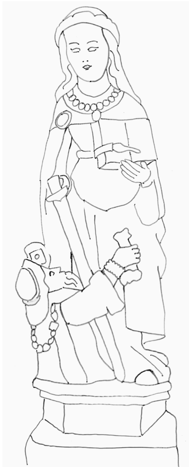
Sainte Catherine , pierre, 1 er quart du 16 e siècle Musée de Vauluisant, Troyes

A l'origine, ma statue était polychrome (elle avait plusieurs couleurs). Avec le temps, la peinture s'est effacée. Imagine quelles pouvaient être mes couleurs puis colorie moi.