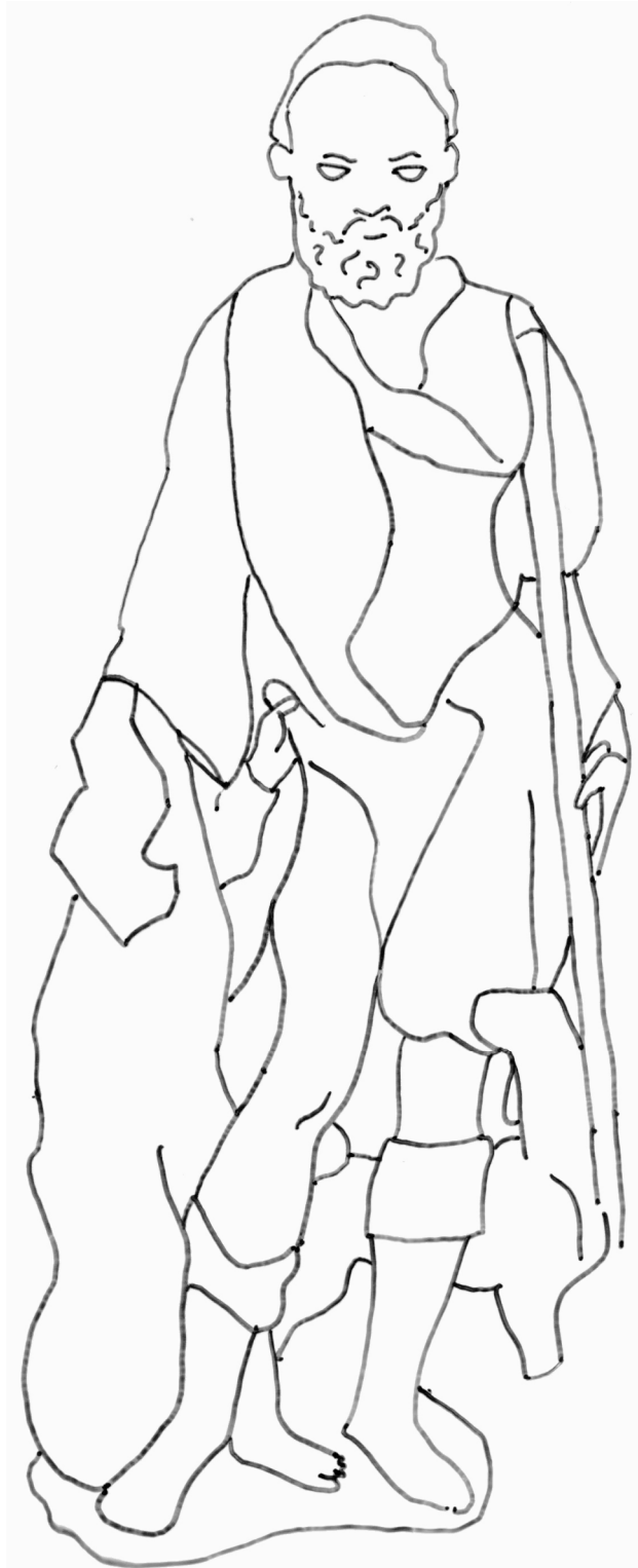
Saint Roch, pierre, 1 ère moitié du 16 e siècle Musée de Vauluisant, Troyes

Je suis saint Roch . J'ai attrapé la maladie de la peste qui m'a laissé une blessure à la cuisse. Un ange venait me soigner et un chien m'apportait chaque jour un morceau de pain. A l'origine, ma statue était polychrome (elle avait plusieurs couleurs). Avec le temps, la peinture s'est effacée. Imagine quelles pouvaient être mes couleurs puis colorie moi. Tu peux également dessiner ma blessure à la cuisse.