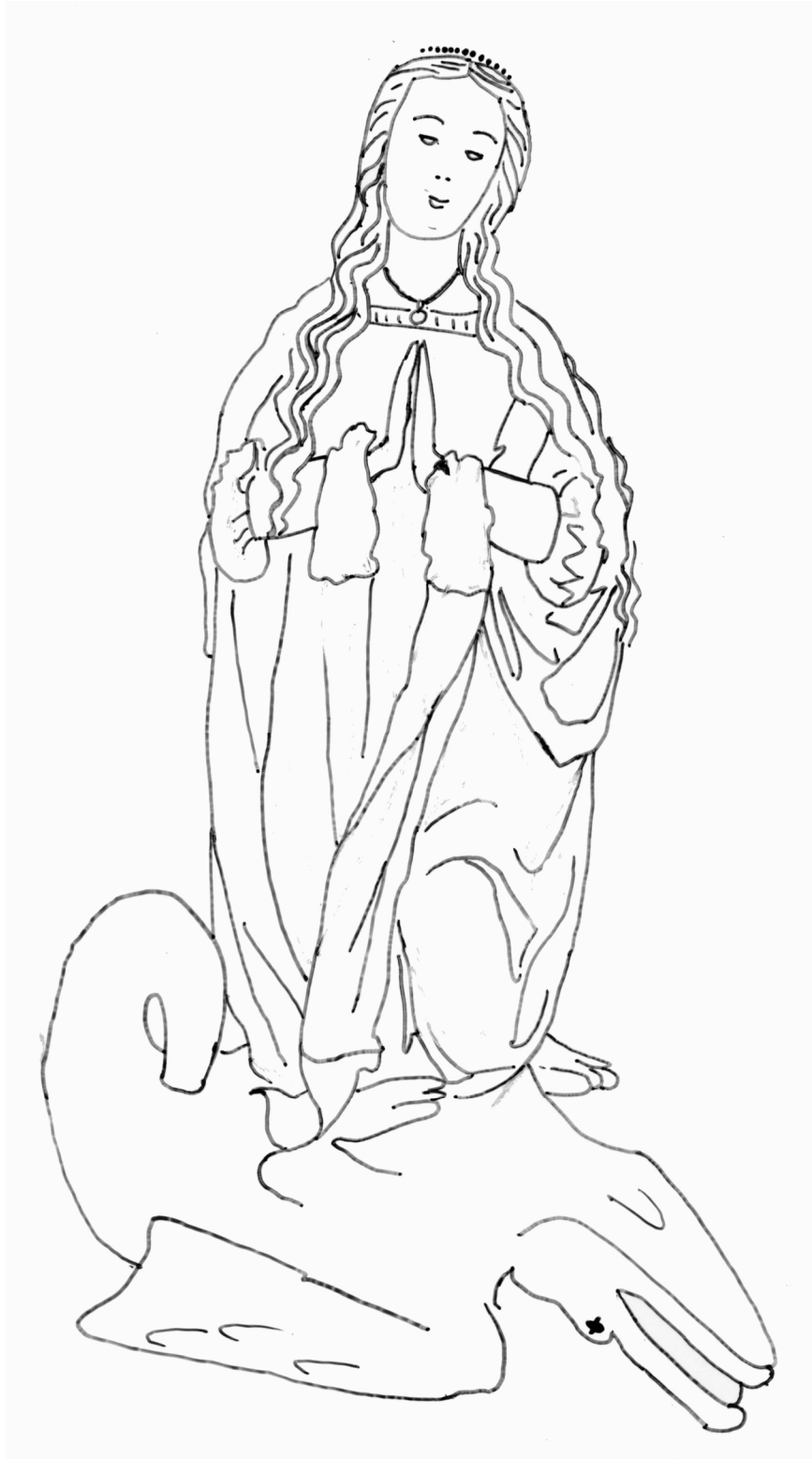
Sainte Marguerite , pierre, 1 er quart du 16 e siècle Musée de Vauluisant, Troyes

Je suis sainte Marguerite . J'ai été attaquée par un dragon qui m'a avalée. J'ai réussi à sortir de son ventre. A l'origine, ma statue était polychrome (elle avait plusieurs couleurs). Avec le temps, la peinture s'est effacée. Imagine quelles pouvaient être mes couleurs puis colorie moi.