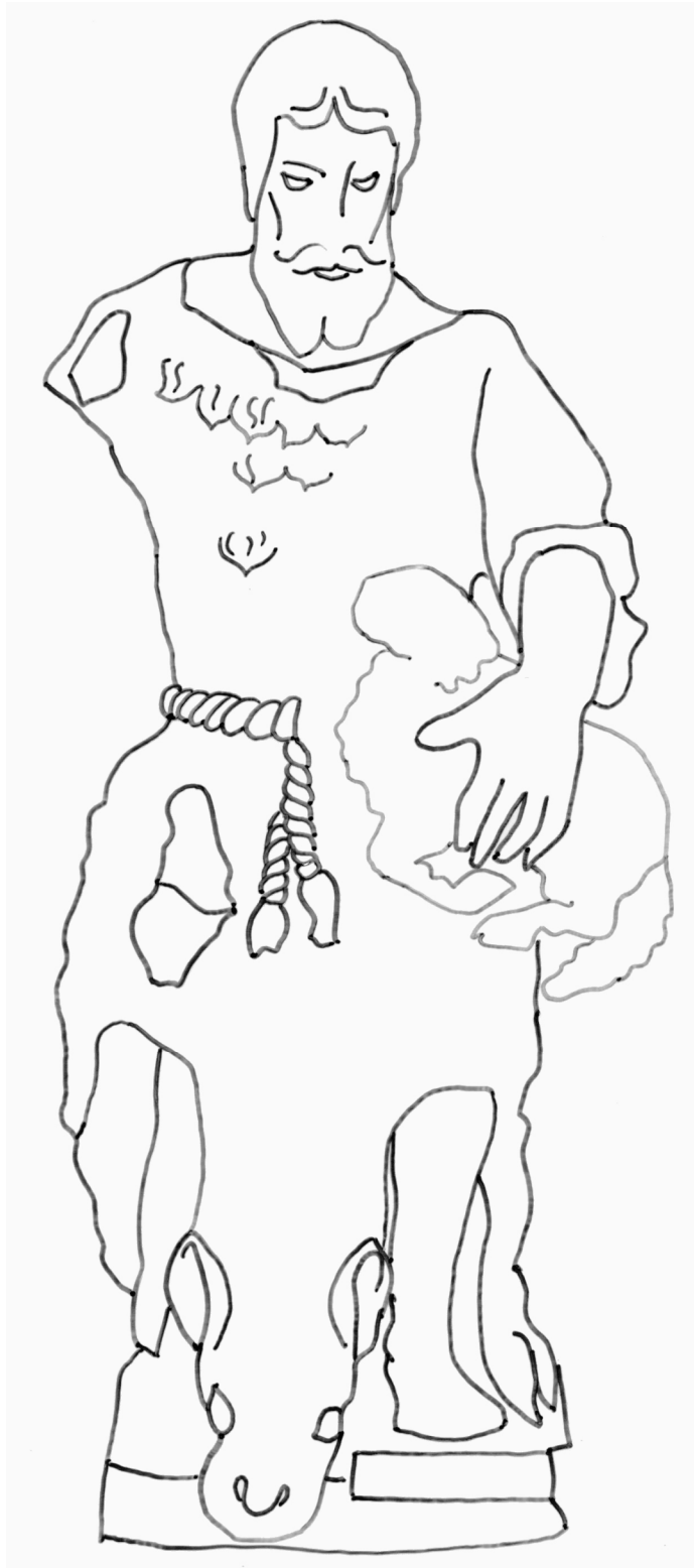
Saint Jean-Baptiste, pierre, 1554 Musée de Vauluisant, Troyes

Je suis saint Jean-Baptiste . Je vivais seul dans le désert et je portais une tunique en peau de mouton. A l'origine, ma statue était polychrome (elle avait plusieurs couleurs). Avec le temps, la peinture s'est effacée. Imagine quelles pouvaient être mes couleurs puis colorie moi.