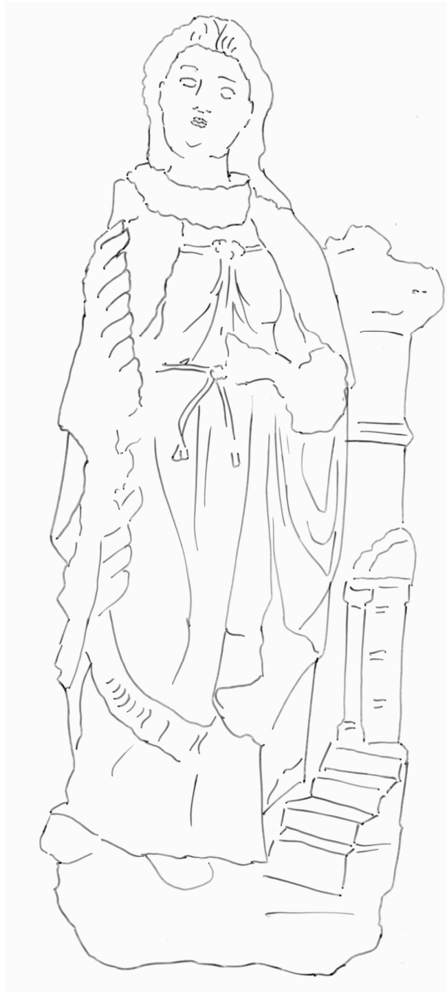
Sainte Barbe, pierre, 2 e moitié du 16 e siècle Musée de Vauluisant, Troyes

A l'origine, ma statue était polychrome (elle avait plusieurs couleurs). Avec le temps, la peinture s'est effacée, tu peux encore en voir quelques traces. Imagine quelles pouvaient être mes couleurs puis colorie moi.