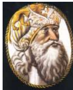
Homme portant une coiffe, 2 e quart du 16 e siècle