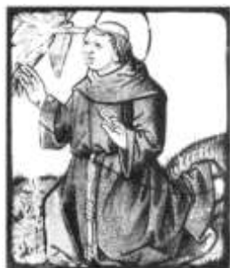
Saint François d'Assise, dernier tiers du 15 e siècle

L'expression, l'attitude des personnages sont mieux rendues, le dessin s'affine.