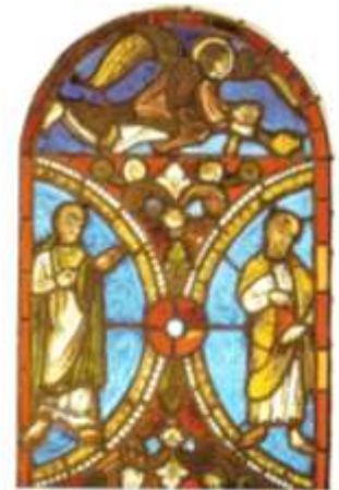
Exemple non présenté dans le musée.