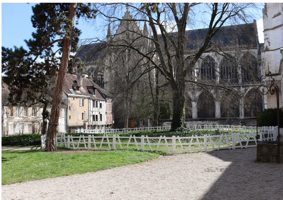
Le jardin du musée des Beaux-Arts et d'Archéologie (Saint-Loup)